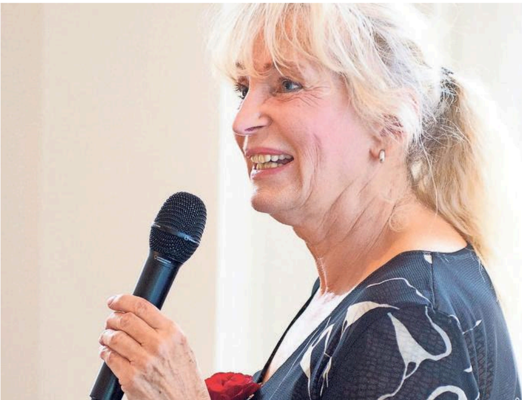
Schrijfster Tessa de Loo.